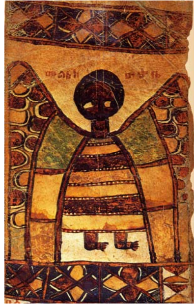
Mälak 'uqabé, Skytsengelen fra Ethiopia

Skytsengel, søte følgesven, Ikkje forlat meg, Verken om natta, eller om dagen, Ikkje la meg vere aleine, Då vil eg miste vegen