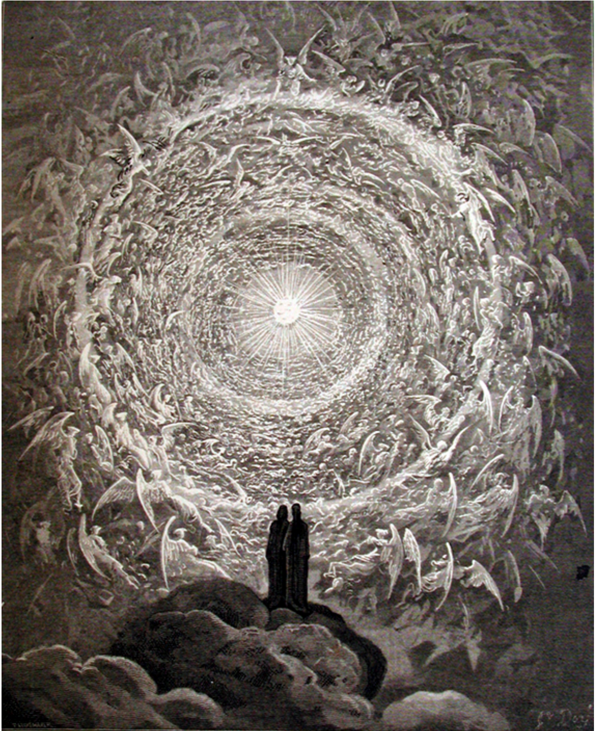
Gustave Doré, La Divina Comedia, Dante Alighiere